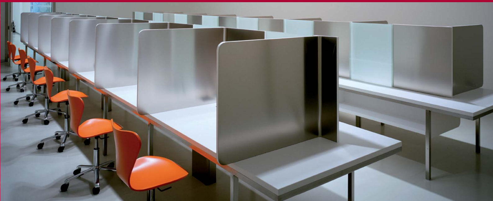
Mesas de trabajo