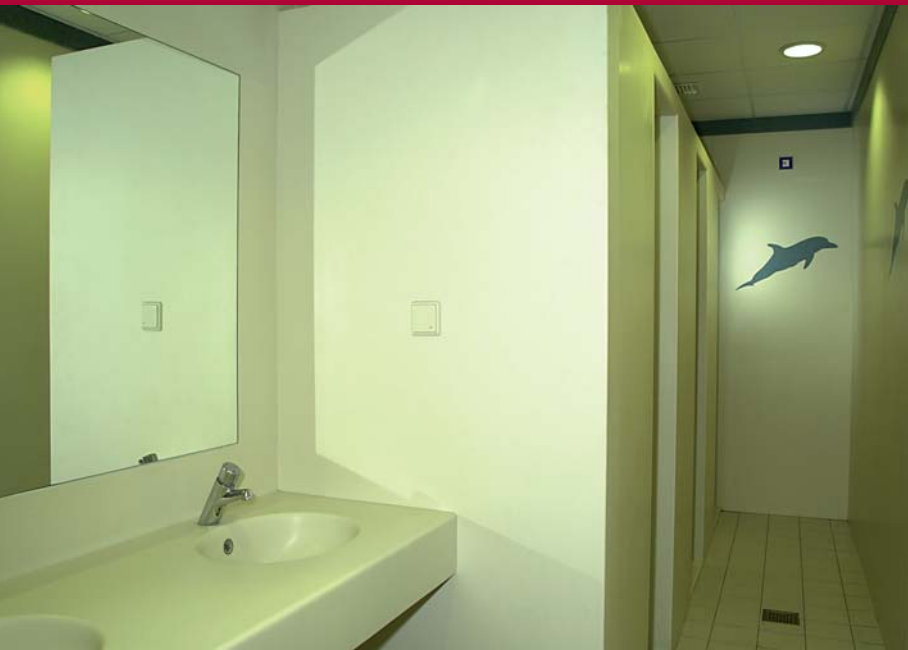
Revestimiento y encimera con lavabo integrado