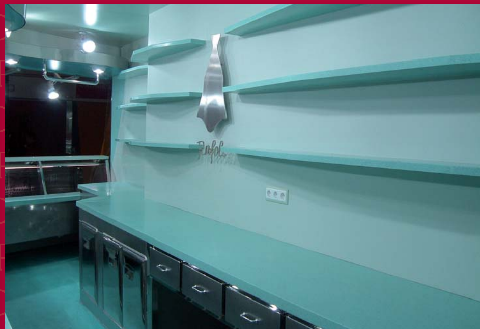
Tienda Mercat Santa Catarina -Barcelona-